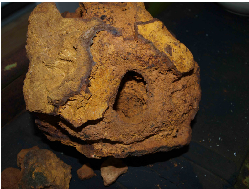
Wascherzstücke so, wie sie in den Gruben gefunden wurden.