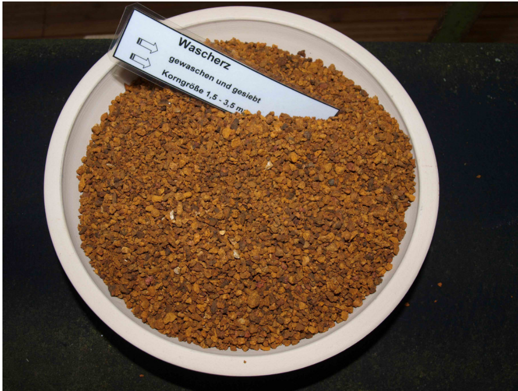
Hier eine Probe einer sog. Siebfraction.